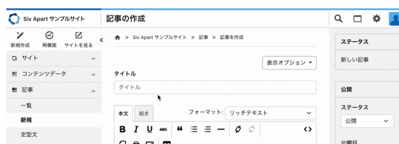
新設したヘッダーメニューと、< ボタンで折りたためるようになった左サイドバー

ヘッダーメニューを新たに設け、左サイドバーにはボタンや折りたたみ機能を追加し、よく使う機能により素早くアクセスできるようになりました。あわせて、新デザインはスマートフォンのブラウザからの利用にも対応し、モバイル環境でも快適に操作できます。