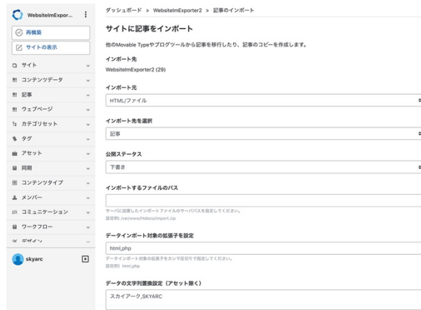
[WebsiteExporter 記事インポート設定画面]

Movable Type Premium の詳細については、以下のリンクをご参照ください。