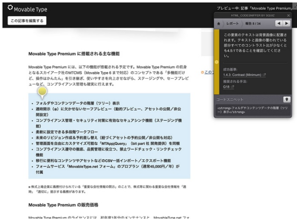
[WCAG 記事プレビュー画面でアクセシビリティを検証 1]