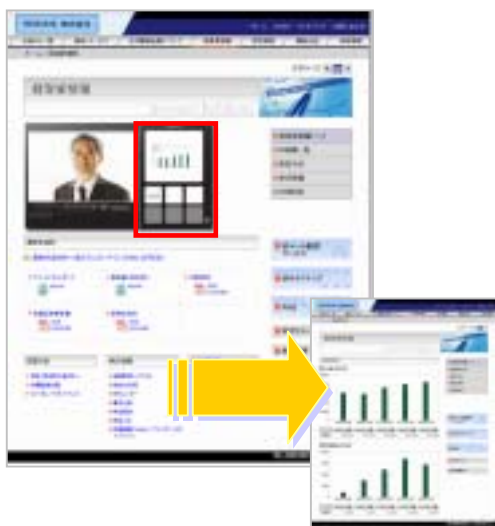
社長挨拶ムービー