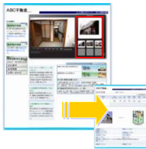
複数物件紹介ムービー